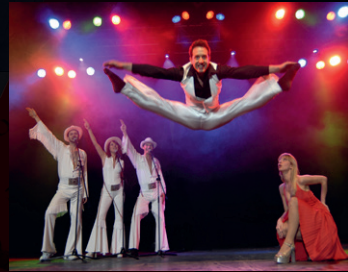
SATURDAY NIGHT FEVER

Die Show „SATURDAY NIGHT FEVER“, mit den großen Hits der 70er und frühen 80er von den Bee Gees, Gloria Gaynor, Boney M., The Village People uvm. Die akrobatischen Tanzeinlagen in legendären, bunten und glitzernden Kostümen, sowie die Stimmgewalt der Performer gepaart mit genialer Choreografie nehmen die Partyfans auf eine außergewöhnlich Zeitreise mit.